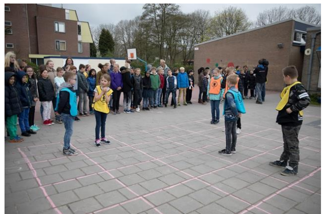
Kinderen van de Theo Thijssenschool Assen bij de aftrap van het Schaakproject in Drenthe